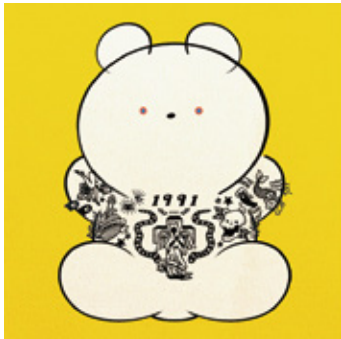
イラストレーター 大河 紀

岡山県出身、東京都在住。2014 年多摩美術大学グラフィックデザイン学科卒。マガジンハウス雑誌『POPEYE』をはじめ、挿絵や装画、PR ビジュアルなどを手がけている。